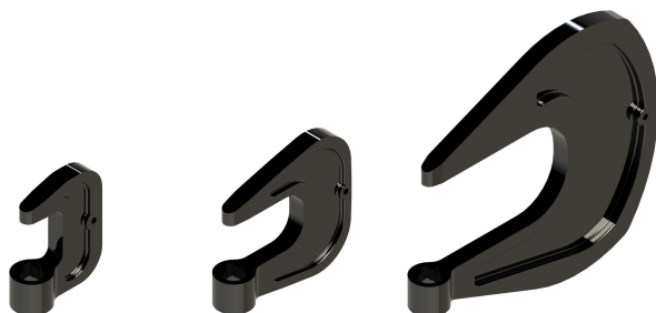
Ref: 16.178.06.04 Bras 40mm (1-1/2") inclus avec le RG500

Profondeur des bras..... 40mm - 110mm - 240mm (1-1/2" - 4-1/2" - 9-1/2")